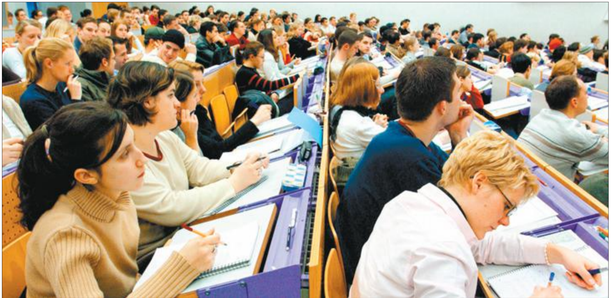
Pauken für den Studienabschluss: Viele Studenten quält vor wichtigen Prüfungen die Angst

Freie Radikale führen zu Oxidationsprozessen, die die Zellen angreifen. Sie beschleunigen den Gewebsverfall und verursachen die typischen Alterserscheinungen. Ein Seminar der Naturheilgesellschaft Stuttgart am Samstag, 10. März, 14 bis 18 Uhr, zeigt auf, was die Entstehung freier Radikale begünstigt, welche Auswirkungen sie auf das Wohlbefinden haben und wie ein Zuviel neutralisiert werden kann. Infos / Anmeldung unter ☎ 07 11 / 6 33 68 25. we